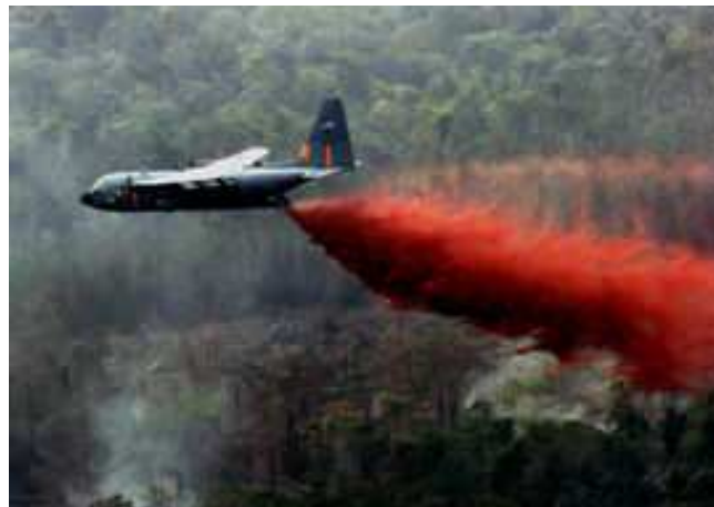
Figur 2: Brandbekæmpelse.

Se endvidere [Wik2] der indeholder en liste over nogle af de største kendte skovbrande i nyere tid.