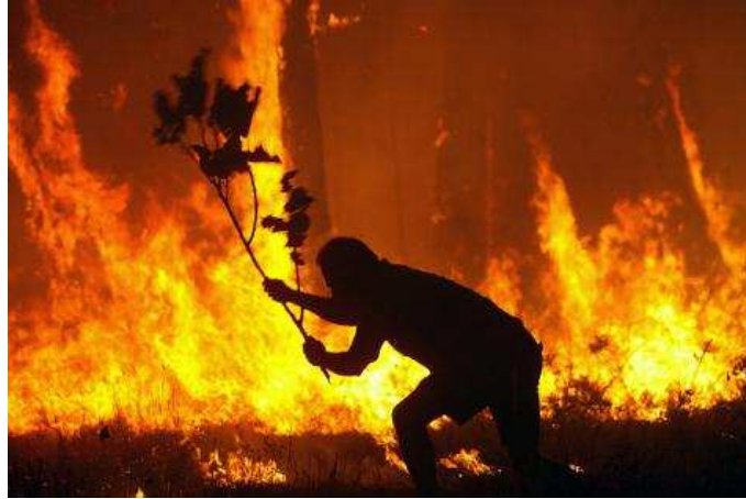
Figur 1: Brand!!